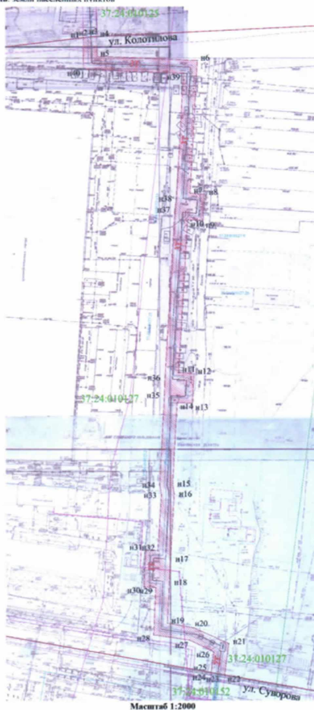
Сведения о земельном участке