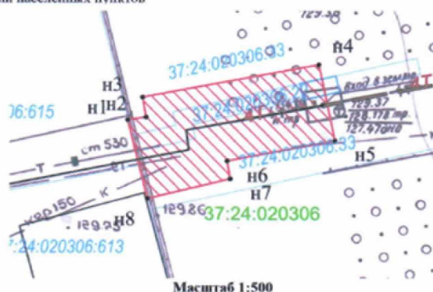
Координаты поворотных точек границ сервитута Система координат: МСК г. Иваново

Адрес (местоположение): обл. Ивановская, г. Иваново, ул. Гнедина Площадь планируемого публичного сервитута: 195 кв. м. Категория земель: земли населенных пунктов