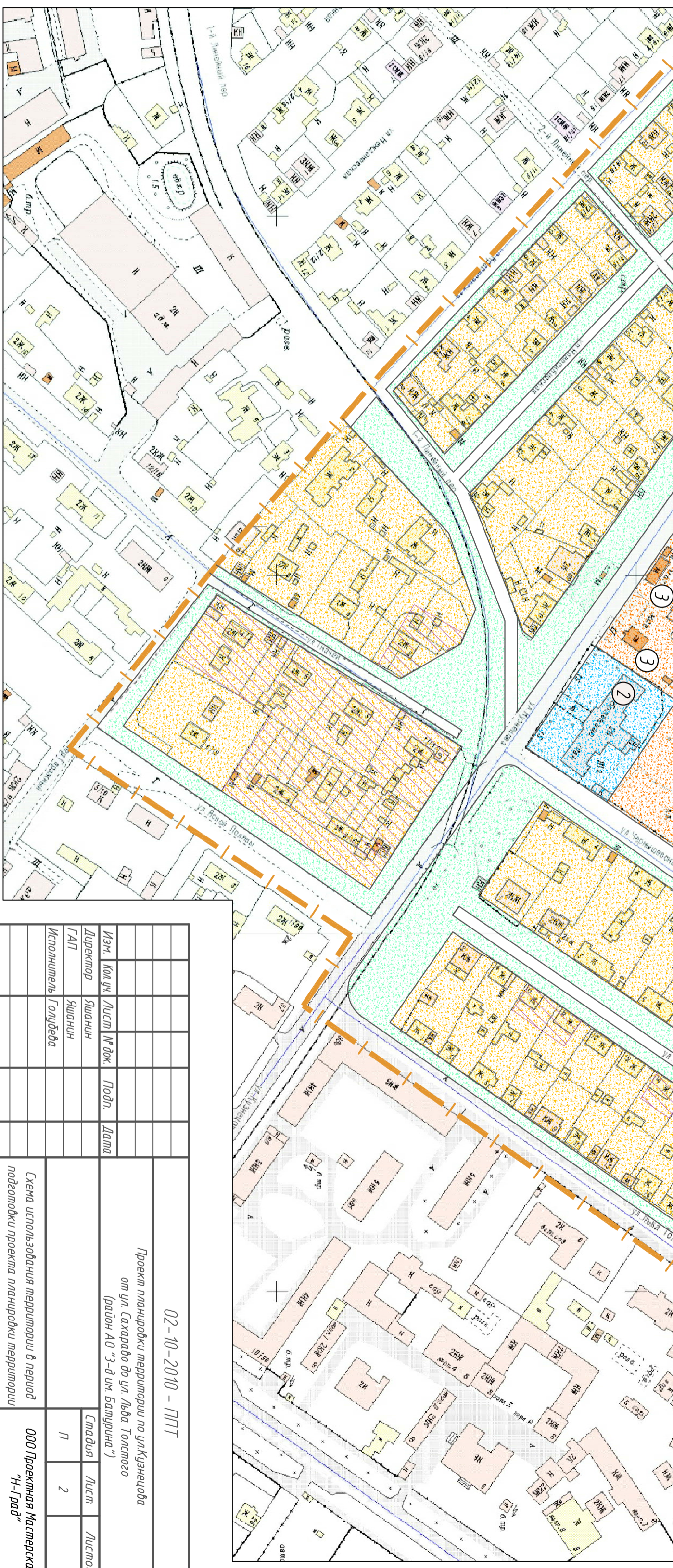
Схема использования территории в период подготовки проекта планировки территории