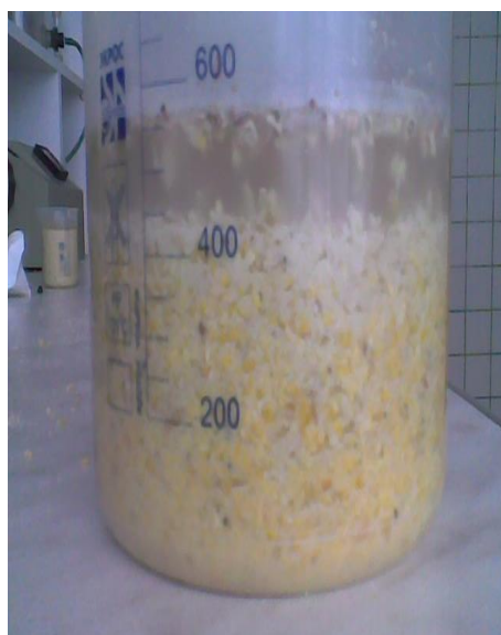
Плющенная кукуруза без обработки