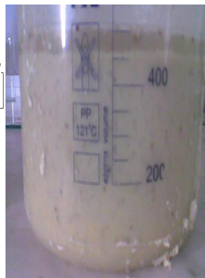
Диспергированная кормовая смесь