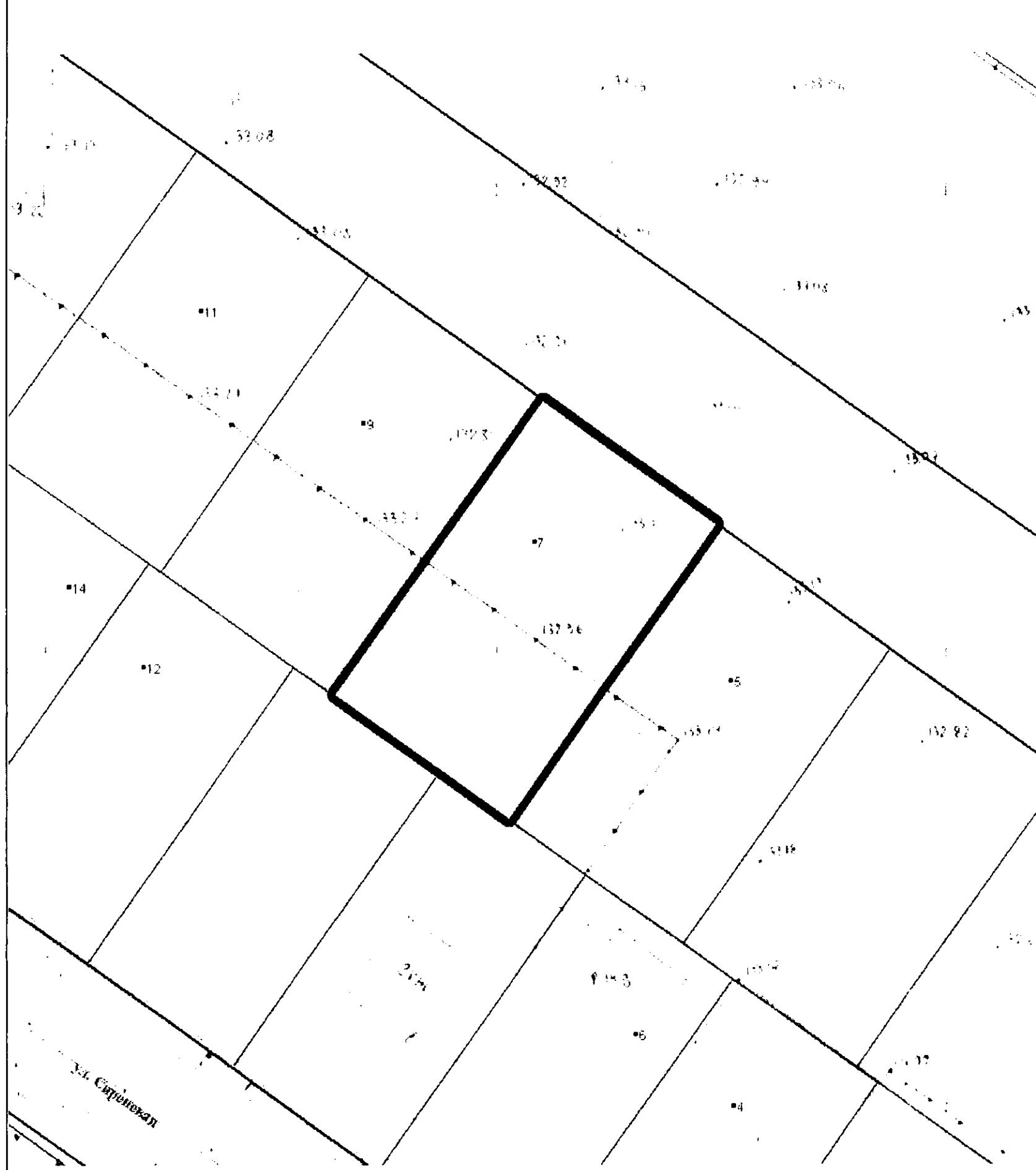
СХЕМА РАСПОЛОЖЕНИЯ ЗЕМЕЛЬНОГО УЧАСТКА ПО АДРЕСУ: ГОРОД ИВАНОВО, УЛИЦА КЛЕНОВАЯ, ЗЕМЕЛЬНЫЙ УЧАСТОК 7, ДЛЯ ИНДИВИДУАЛЬНОГО ЖИЛИЩНОГО СТРОИТЕЛЬСТВА М 1:500