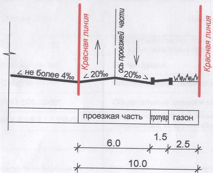
Поперчный профиль по ул. Станционная (Категория улиц и дорог - проезд основной)