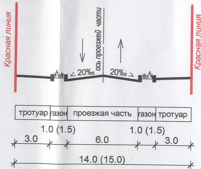
Поперчный профиль по пер. Пограничному (по ул. 1-ой Сибирской) (Категория улиц и дорог - улицы и дороги местного значения)